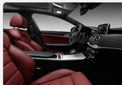
Red color package (RCP)