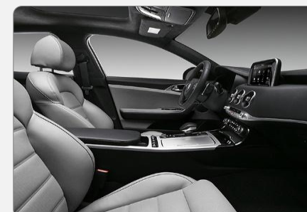
Grey color package (GCP)