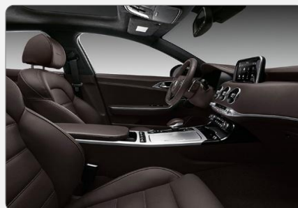
Brown one tone (YBR)