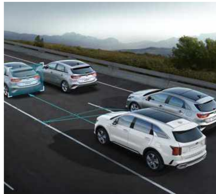
СИСТЕМА ЗА ПРЕДУПРЕЖДЕНИЕ ПРИ НЕВОЛНО НАПУСКАНЕ НА ПЪТНАТА ЛЕНТА (LFA)