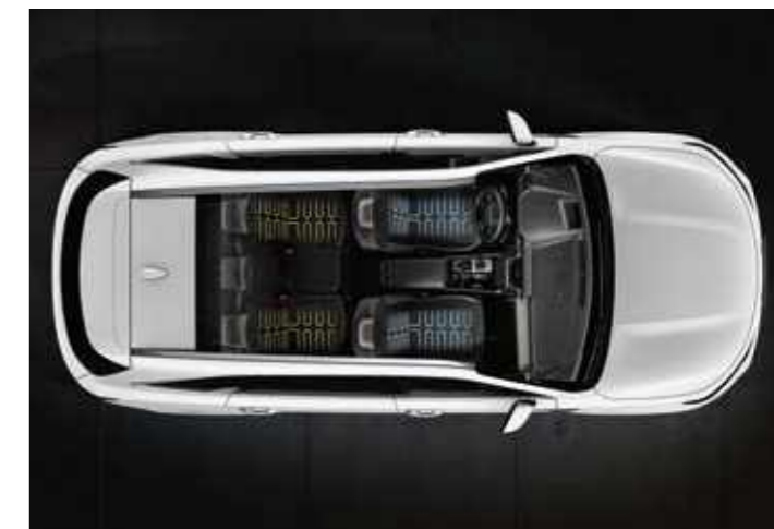
ОТОПЛЯЕМИ И ВЕНТИЛИРАНИ СЕДАЛКИ