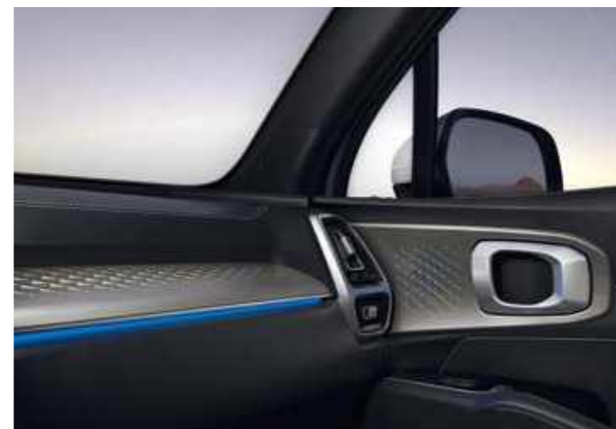
СИСТЕМА MOOD LIGHTING