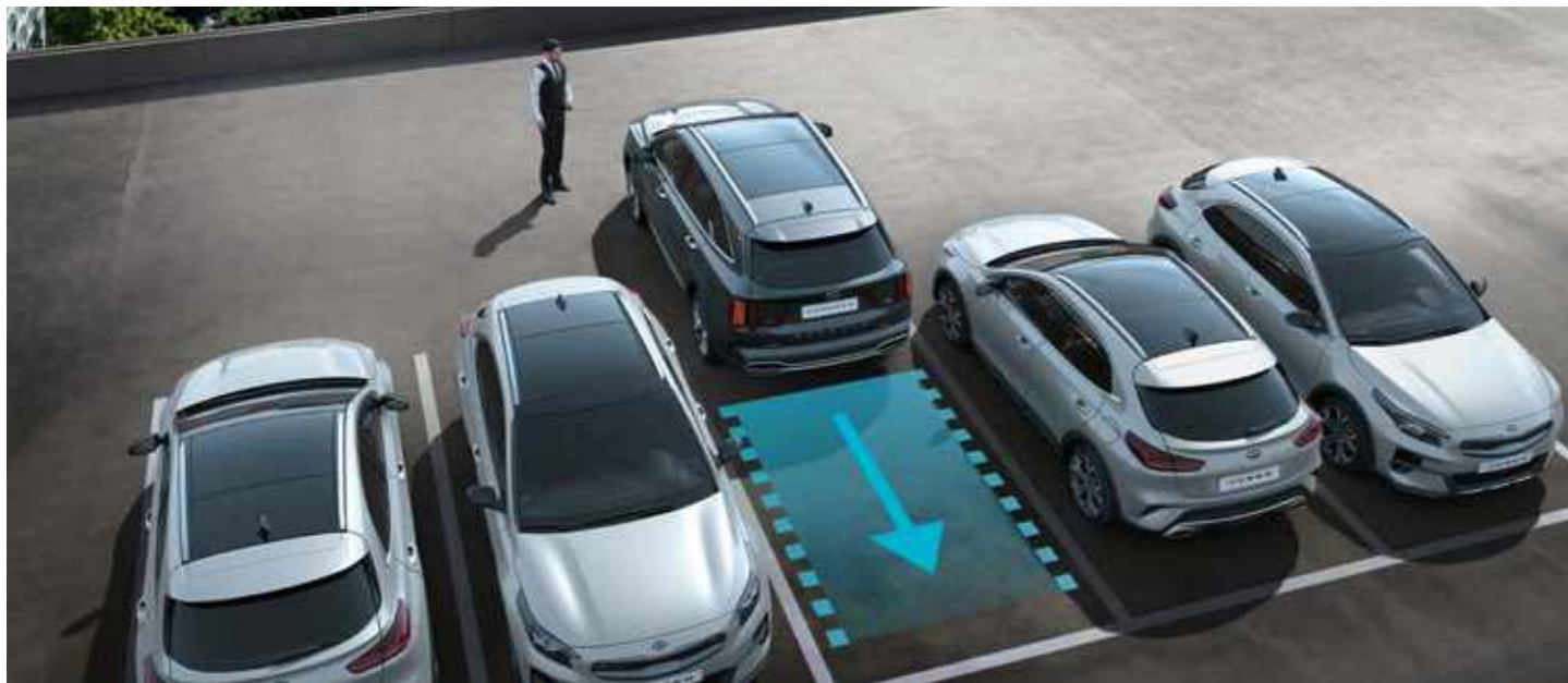
АСИСТЕНТ ЗА ДИСТАНЦИОННО АВТОМАТИЧНО ПАРКИРАНЕ (RSPA-ENTRY)