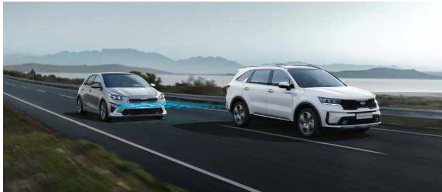
СИСТЕМА ЗА ПРЕДУПРЕЖДЕНИЕ ПРИ НАЛИЧИЕ НА АВТОМОБИЛ В МЪРТВАТА ЗОНА (BSA)