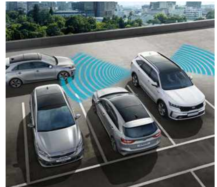
АСИСТЕНТ ЗА ПРЕДУПРЕЖДЕНИЕ ЗА ПРЕСИЧАЩИ ОТЗАД АВТОМОБИЛИ (RCCA)