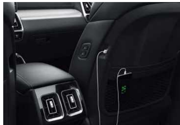
USB ВХОДОВЕ ЗА ВСИЧКИ РЕДОВЕ СЕДАЛКИ