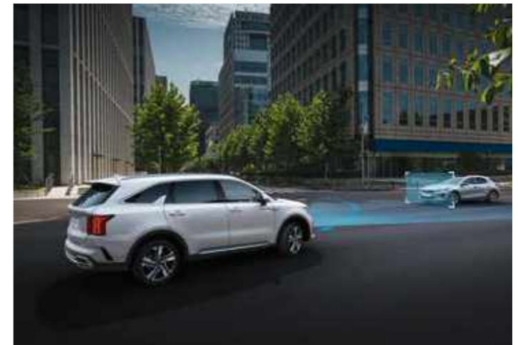
СИСТЕМА ЗА АВТОНОМНО СПИРАНЕ С ФУНКЦИЯ ЗА РАЗПОЗНАВАНЕ НА ПЕШЕХОДЦИ, КОЛОЕЗДАЧИ И ДРУГИ ПРЕВОЗНИ СРЕДСТВА (FCA)