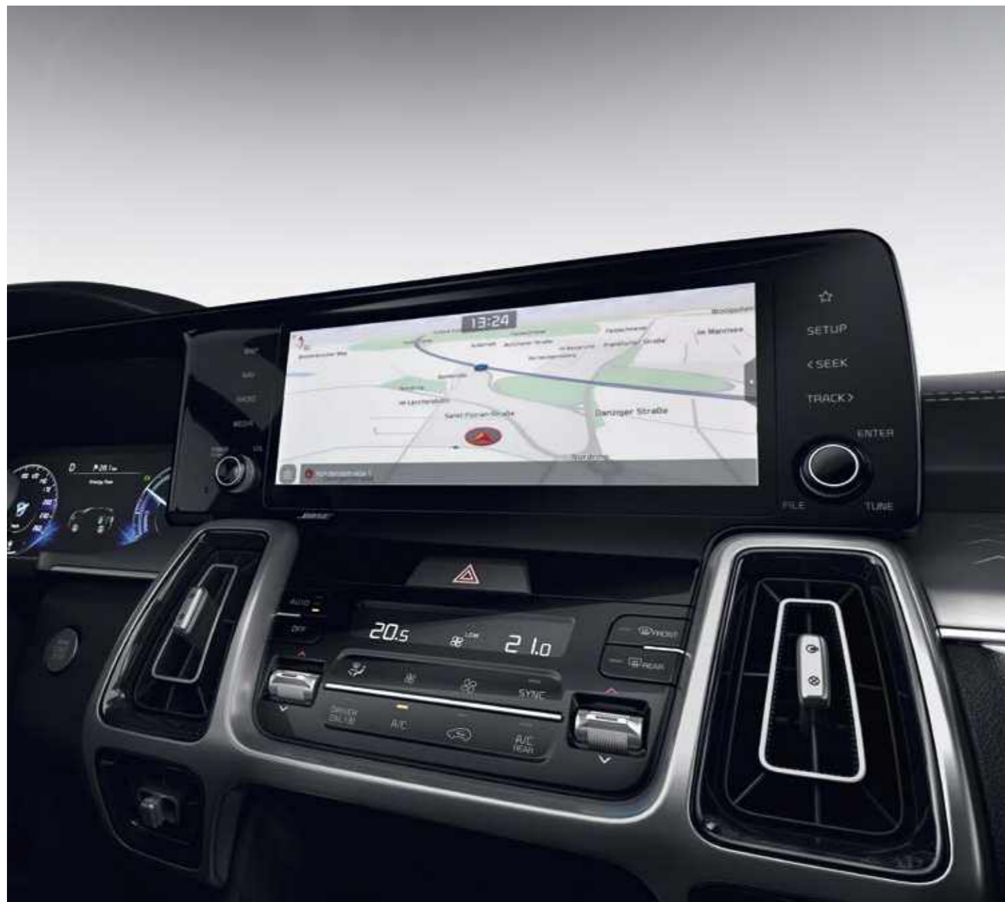
10.25" НАВИГАЦИОННА СИСТЕМА