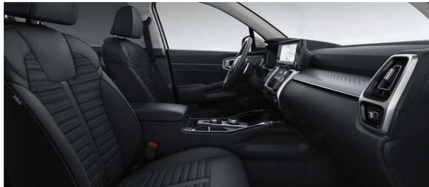
STANDARD BLACK CLOTH