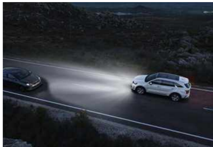
СИСТЕМА ЗА АВТОНОМНО ВКЛЮЧВАНЕ И ИЗКЛЮЧВАНЕ НА ДЪЛГИТЕ СВЕТЛИНИ (HBA)