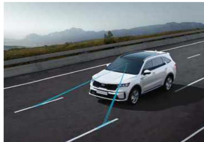
АСИСТЕНТ ЗА ПОДДЪРЖАНЕ НА ТРАЕКТОРИЯТА В ЛЕНТАТА НА ДВИЖЕНИЕ (LKA)