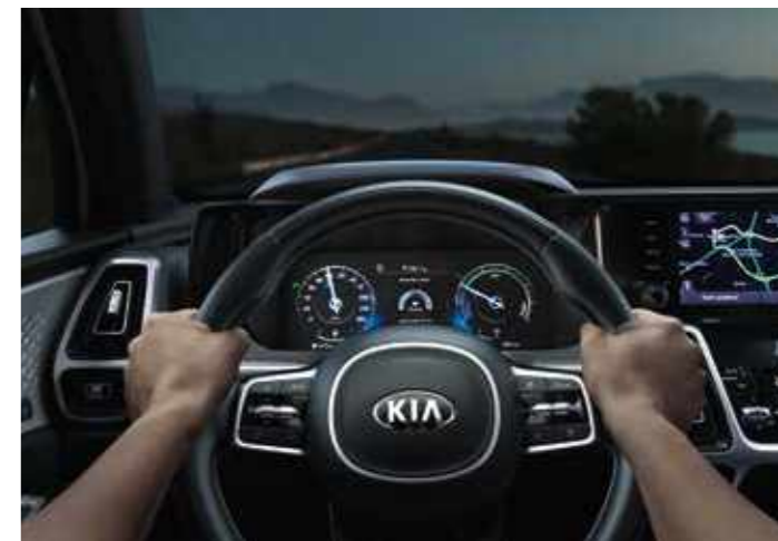
СИСТЕМА ЗА ПРЕДУПРЕЖДЕНИЕ ПРИ ЗАГУБА НА ВНИМАНИЕ И СЪНЛИВОСТ ОТ СТРАНА НА ВОДАЧА (DAW)