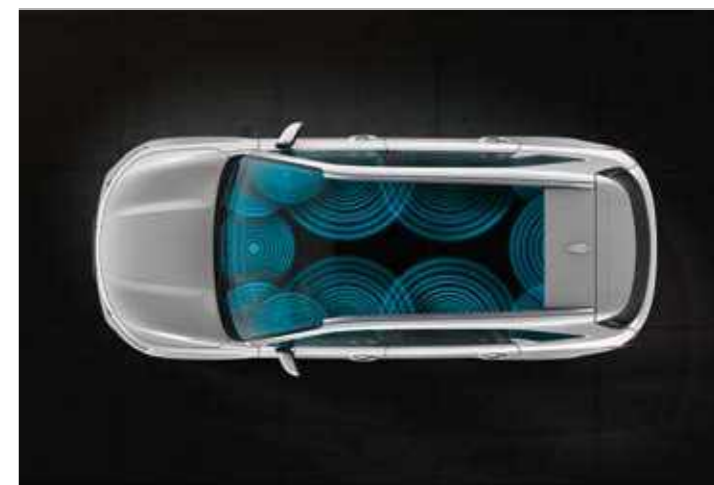
BOSE® ПРЕМИУМ САУНД СИСТЕМА