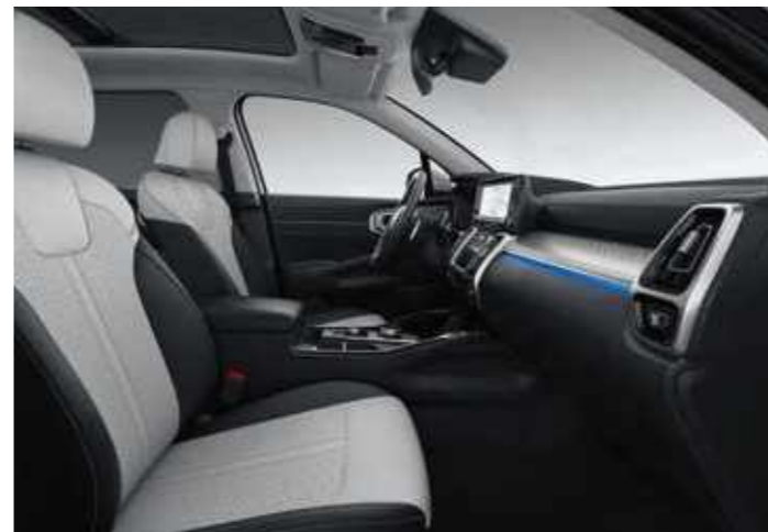
OPTIONAL 2-TONE GREY/BLACK LEATHER

Вашият нов KIA Sorento ще ви предложи изискани интериорни опции в унисон с вашия стил. Можете да изберете между черен интериорен пакет, кожен салон (едноцветен или двуцветен в сиво и черно) или тапицерия изработена от висококачествена Nappa кожа.