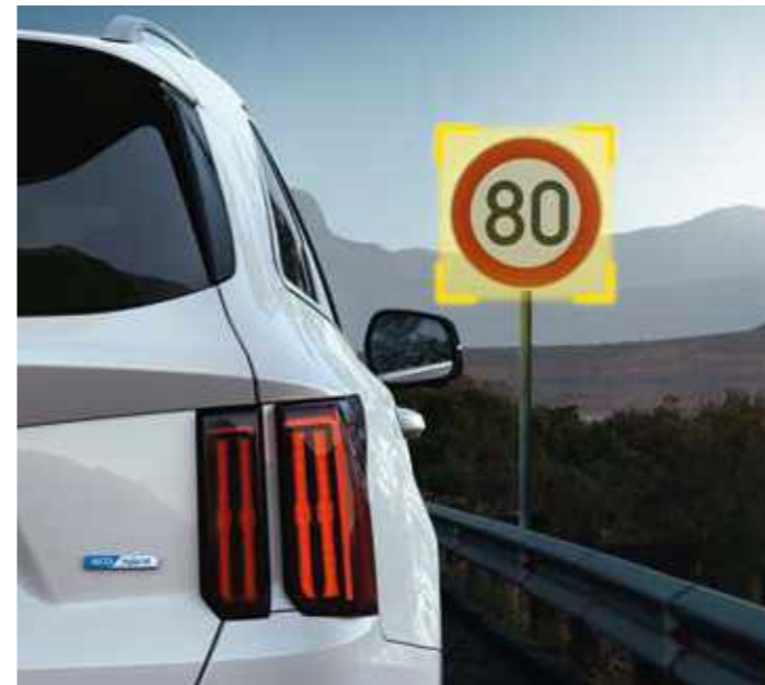
ИНТЕЛИГЕНТЕН АСИСТЕНТ ЗА ПРЕДУПРЕЖДЕНИЕ ПРИ ОГРАНИЧЕНИЕ НА СКОРОСТТА (ISLA)

Докато изпитвате удоволствие от шофирането и се наслаждавате на динамично управление, е важно да знаете, че сте постоянно защитени. Sorento ще ви предложи поредица високотехнологични решения за по-безопасно пътуване.