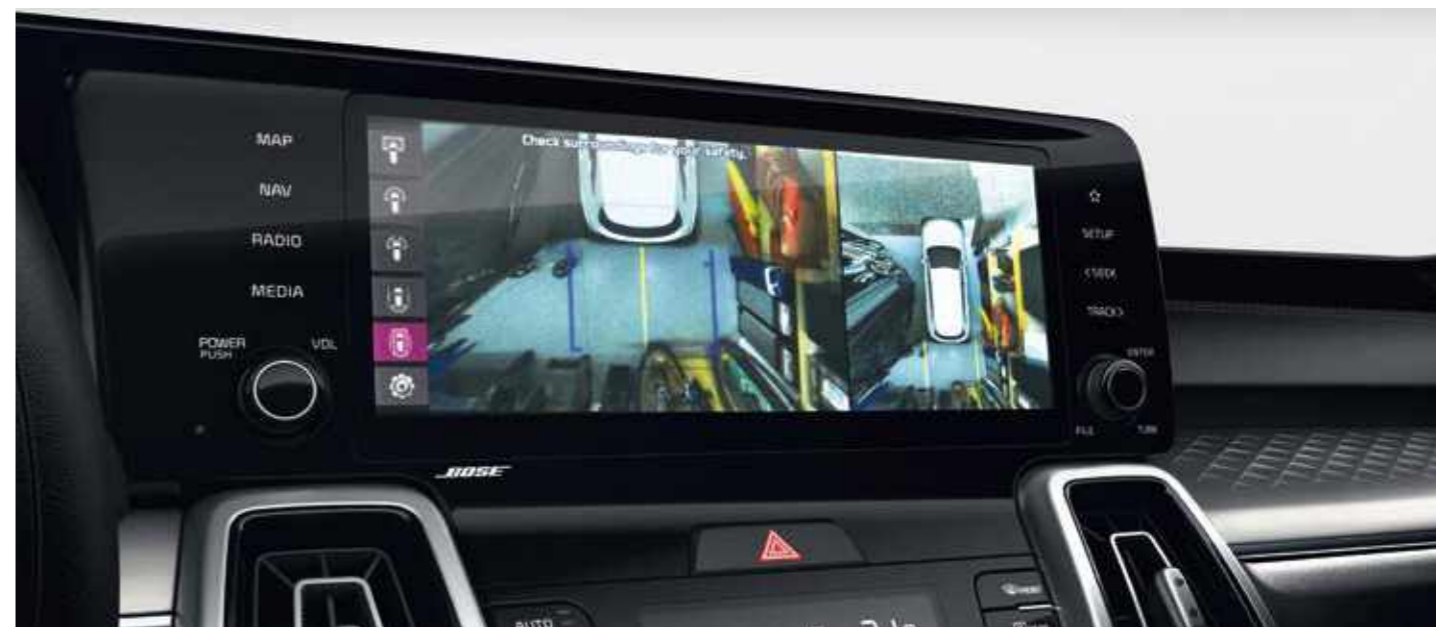
КАМЕРИ ЗА НАБЛЮДЕНИЕ НА 360° ОКОЛО АВТОМОБИЛА

Споделете с вашите близки удоволствието от шофирането в компанията на ергономично проектирания, просторен и удобен салон на изцяло новия KIA Sorento.