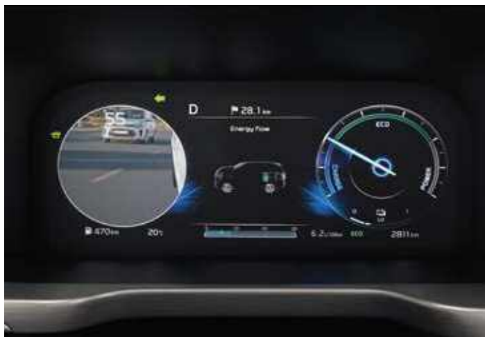
КАМЕРА ЗА КОНТРОЛ НА МЪРТВАТА ЗОНА (BVM)