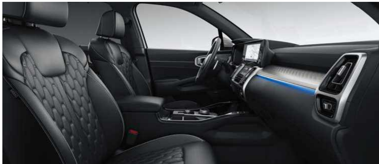
BLACK QUILTED NAPPA LEATHER