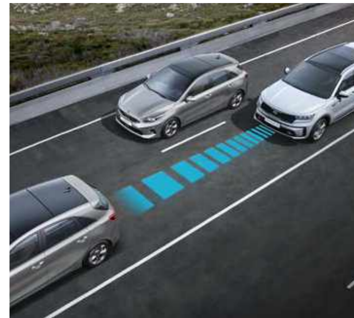
ИНТЕЛИГЕНТЕН АВТОПИЛОТ С ФУНКЦИЯ ЗА ТРЪГВАНЕ И СПИРАНЕ