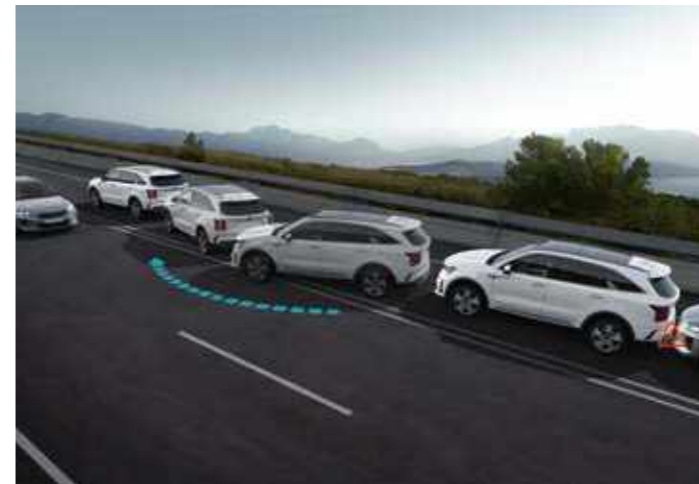
СИСТЕМА ЗА ИЗБЯГВАНЕ НА ВТОРИЧНИ СБЛЪСЪЦИ (MSVA)