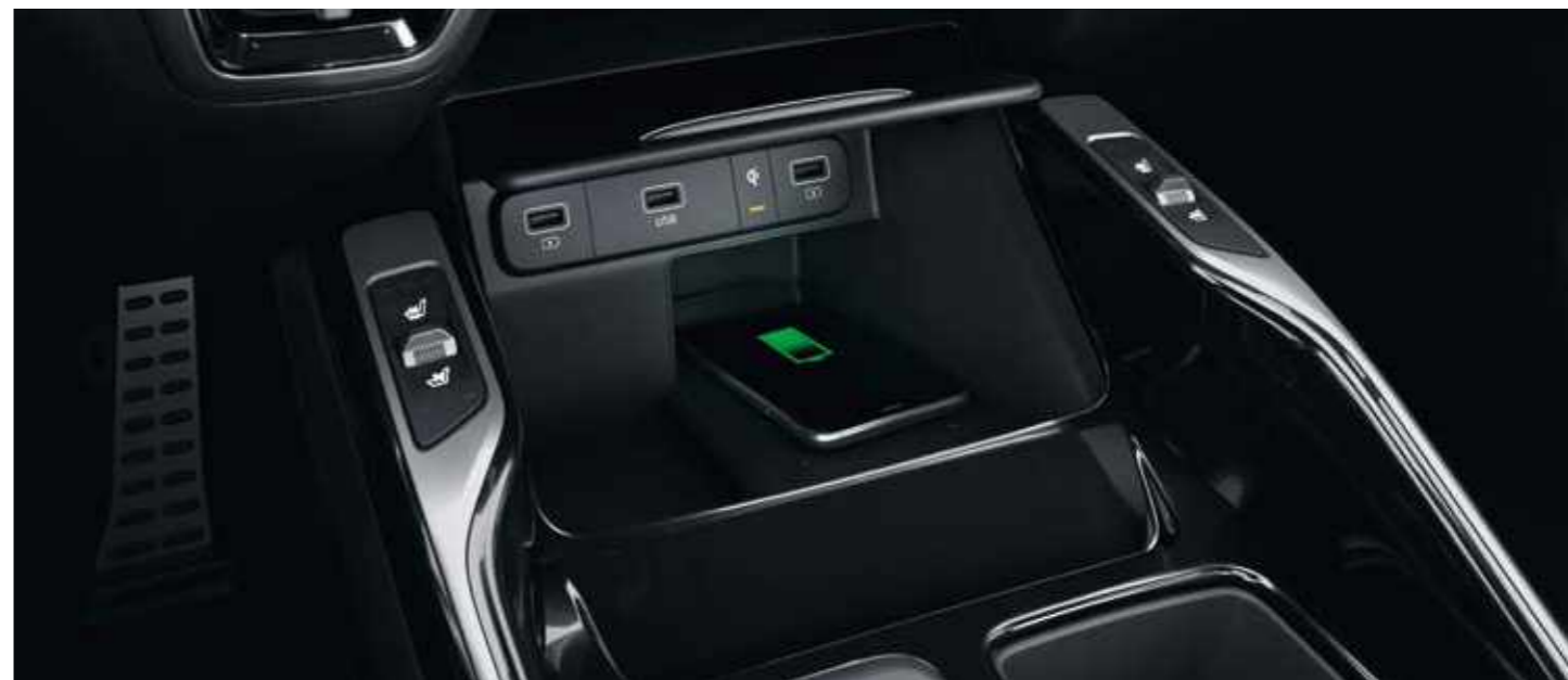
БЕЗЖИЧНО ЗАРЯДНО УСТРОЙСТВО ЗА СМАРТФОН