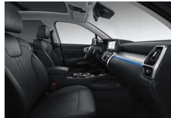
OPTIONAL BLACK LEATHER