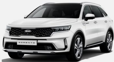
Pure White (UD)