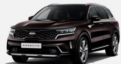
Essence Brown (BE2)