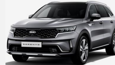
Steel Grey (KLG)