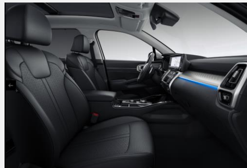
Black leather - one tone