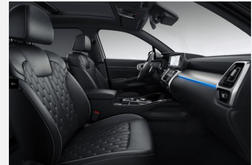
Black premium leather