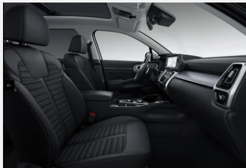
Black textile - one tone