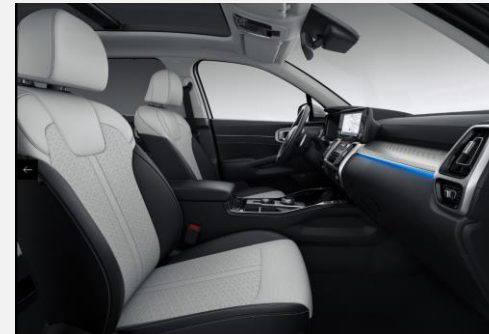
Grey color package