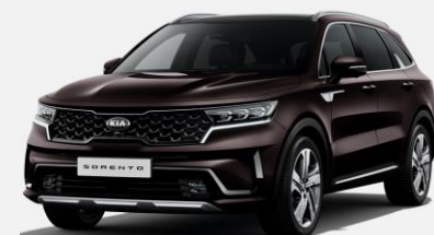
Essence Brown (BE2)